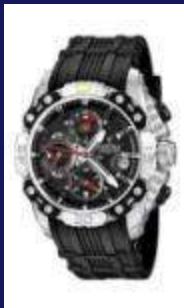
Tour de France Chronometer