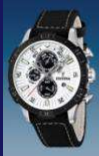
Chrono & Multifunction